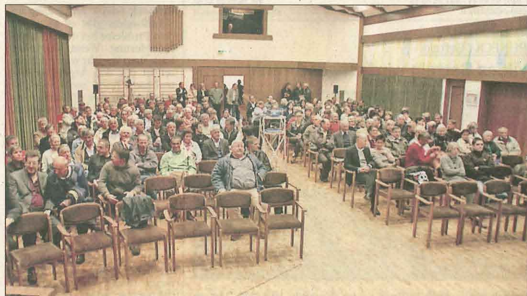
Zahlreiche Reischacher informierten sich über den Ablauf der am Sonntag angesetzten selbstverwalteten Volksbefragung zum Projekt Ried.